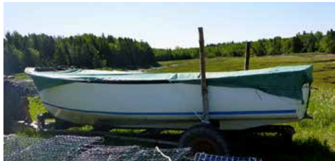
Figure 1. Bateau C19496NB (vue de profil)

Au moment de l'événement, le bateau avait 2 réservoirs de carburant portatifs de 23 litres près de la poupe côté bâbord, et 1 réservoir de carburant portatif de 20 litres et 2 bidons d'essence de 20 litres à l'avant. Le bateau avait aussi 1 pompe d'assèchement dans la cale avant. Le bateau transportait 8 casiers à homards en plastique (superposés), 1 casier simple, 4 bacs de manutention en plastique (superposés), 1 bac simple placé sur les casiers