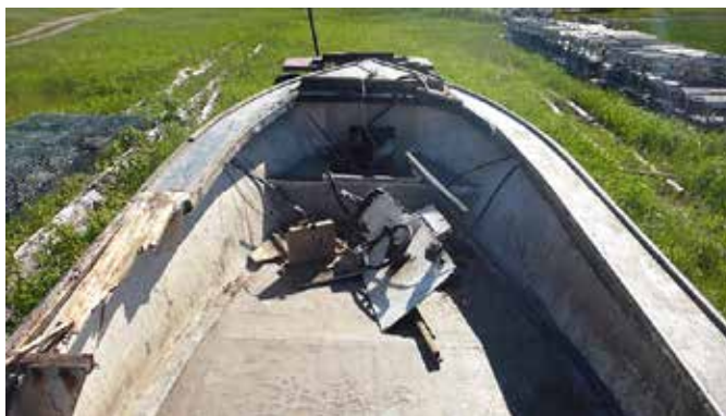
Figure 3. Détails des dommages subis par le C19496NB

La petite timonerie ouverte, le plat-bord arrière ainsi que le haleur de casier à homards et sa potence ont été arrachés du bateau renversé au cours de son remorquage au quai Miller Brook (figure 3). Le moteur hors-bord, le moteur du haleur de casier à homards hydraulique et le matériel électronique ont été contaminés par l'eau salée.