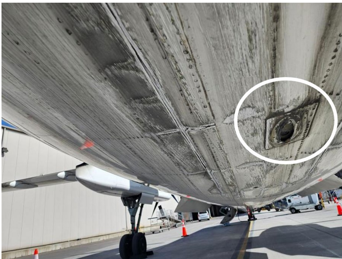
Figure 1. Dommages sur la structure inférieure de la partie arrière du fuselage et coupe-circuit en cas de contact queue-sol de l'aéronef à l'étude (Source : tierce partie [avec permission], avec annotations du BST)

L'inspection a révélé des ondulations dans le revêtement intérieur de la nacelle du moteur gauche. L'enquête n'a pas permis de déterminer si ces dommages ont été subis pendant l'événement.