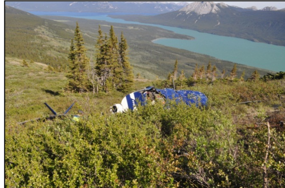
Photo 2. Lieu de l'accident vu en direction de l'est-sud-est

Le passager assis à l'avant gauche a subi des blessures mineures et a réussi à sortir de l'épave, puis est retourné à l'appareil pour aider à évacuer le passager assis à l'arrière, qui avait subi des blessures graves et avait besoin d'aide pour sortir de l'appareil. Le passager avant gauche a également remarqué une forte odeur de carburant, et a transporté le passager gravement blessé loin de l'appareil. De retour à l'appareil pour sortir le pilote, le passager avant gauche a constaté que le pilote était sans vie, et l'a laissé sur place. Le pilote était attaché à son siège au moyen d'un harnais à 4 points et ne portait pas de casque. Le pilote a subi un traumatisme crânien, de graves contusions à d'autres parties de son corps ainsi que des blessures entraînant un arrêt respiratoire.