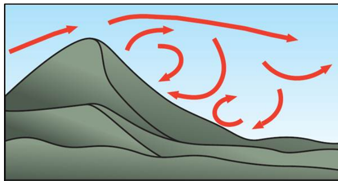
Effets des ondes sous le vent

Quand la circulation rencontre une falaise abrupte ou passe sur un terrain rugueux, le vent devient turbulent et en rafales. Il se forme souvent des tourbillons sous le vent des collines, ce qui crée des zones stationnaires de vent fort et de vent faible. Ces zones de vent fort sont assez prévisibles et persistent