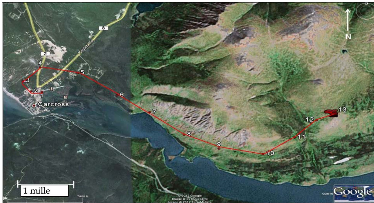
Figure 1. Journal de suivi GPS du vol C-GHZN

Les vols de la journée décollaient à partir du hangar de Horizon Helicopters Ltd. (Horizon Helicopters) situé à l'aéroport international de Whitehorse à Whitehorse (Yukon). Le vol avait pour objet de transporter 2 chercheurs du gouvernement du Yukon vers des emplacements d'appâts d'ours dans la région de Carcross (Yukon). Le vol décolle à 8 h 53 1 et atteint le premier emplacement à 9 h 17. Ensuite, l'hélicoptère se rend à 9 autres emplacements à l'ouest de Carcross avant de s'arrêter pour un ravitaillement en carburant, à 11 h 48. À 12 h 10, l'hélicoptère quitte l'aire de ravitaillement et se dirige vers 9 autres emplacements d'appâts au nord-ouest et au sud-ouest de Carcross. Tout au long de la journée, des vents forts empêchent l'inspection de certains emplacements situés à plus haute altitude. À 14 h 42, l'appareil C-GHZN atterrit à Carcross et est ravitaillé en carburant. En raison des forts vents, le pilote indique que le plan prévu consiste à inspecter le plus grand nombre possible d'emplacements non visités sur le chemin du retour vers Whitehorse. L'hélicoptère quitte Carcross à 15 h 01 pour la dernière étape de la journée, en direction d'un emplacement situé à l'est de Carcross. L'appareil suit la rive nord du lac Tagish et approche de l'emplacement de surveillance de la faune à partir de l'ouest. Le pilote s'est rendu à cet endroit à plusieurs reprises par le passé. La dernière cible GPS 2 est enregistrée à 15 h 07 (figure 1).