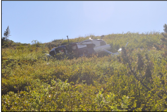
Photo 1. Lieu de l'accident vu en direction de l'ouest

L'enquête a permis de déterminer que le pilote a survolé l'emplacement à partir du sud et a effectué un virage de 180° vers la droite. L'hélicoptère a ensuite ralenti pour se mettre en vol stationnaire, puis a commencé à descendre sur le côté est de la crête. Quelques instants plus tard, l'hélicoptère a été soumis à une rafale de vent venant de l'ouest, ce qui l'a fait dériver vers la gauche, vers le versant est (côté sous le vent) de la crête. L'hélicoptère a alors commencé une descente verticale non maîtrisée. Au cours de cette descente, l'avertisseur sonore de bas régime s'est déclenché et l'indication du tachymètre du rotor principal a chuté de 99 % à 63 %. L'hélicoptère a percuté le côté est de la pente sur le patin droit, puis a rebondi plus bas dans la pente avant de s'immobiliser presque à l'envers sur le côté gauche de son toit (photo 1 et photo 2).