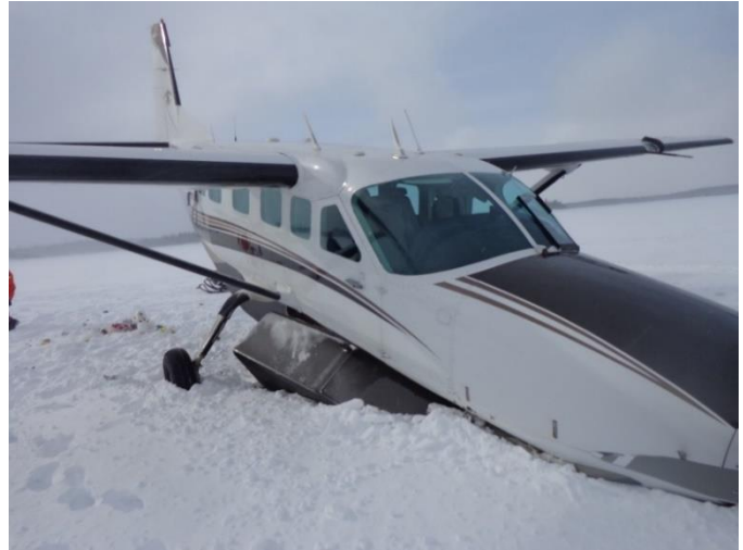
Figure 2. Épave de l'avion en cause dans l'événement à l'étude

Chaque siège était muni d'une ceinture abdominale et d'une ceinture-baudrier à sangle unique. Tous les sièges sont demeurés fixés au plancher de la cabine.