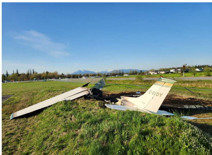
Figure 2. Épave de l'aéronef à l'étude à la suite de l'incendie après l'impact

D'après les preuves vidéo et photographiques de l'accident, ainsi que l'examen du site, l'aéronef était aligné sur l'axe de la piste avant de heurter la camionnette. Après l'impact avec la camionnette et la clôture du périmètre de l'aéroport, l'aéronef a pivoté de 90° vers la droite et a percuté un monticule. L'aéronef a été détruit par l'incendie qui s'est déclaré après l'impact (figure 2). Tous les composants principaux de l'aéronef ont été retrouvés sur le lieu de l'accident.