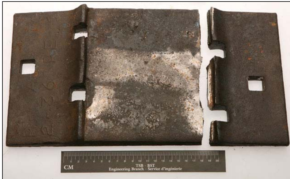
Photo 1. Selle de rail située sous le joint mixte

À l'est des joints, on n'a relevé aucune marque de roues ou de pièces traînantes sur la structure de la voie. Par ailleurs, même si les traverses et le rail étaient en bon état, on a observé un cheminement du rail à l'est du joint mixte, les anticheminants s'étant déplacés vers l'ouest d'environ un pouce. Dans la section de voie située entre le joint mixte et le passage à niveau du Chemin de Dalhousie, le placement des anticheminants était conforme aux indications de la figure 2.