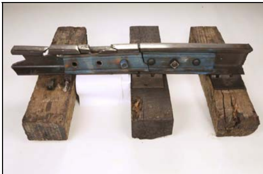
Photo 2. Vue du côté intérieur du joint mixte reconstitué. Le train a roulé de la droite vers la gauche.