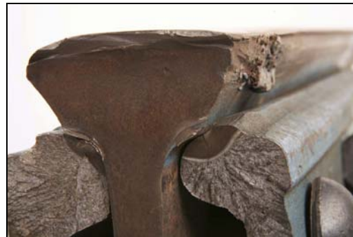
Photo 3. Fissure de fatigue à l'angle supérieur du côté intérieur de l'éclisse