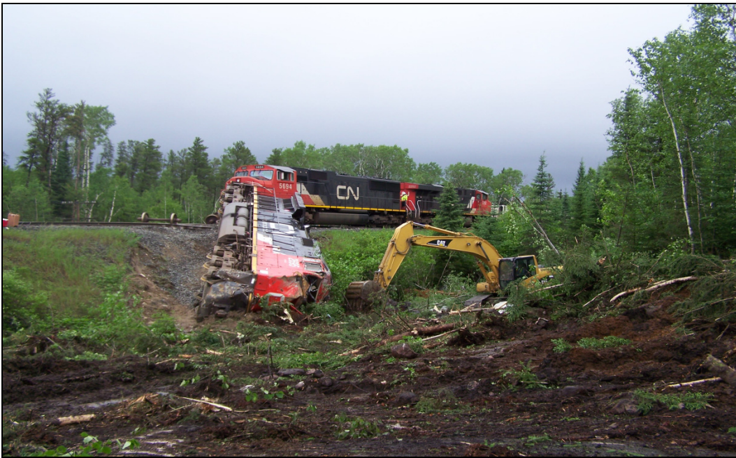
Photo 1. Locomotive de tête numéro CN 2695 après le déraillement

À 6 h 23, le train 101 quitte Favel et se dirige en direction ouest sur la voie principale. À 6 h 30 min 13 s, le train 101 roule à 40 mi/h et la commande des gaz est à la position 8 alors qu'il sort d'une courbe de 4° vers la droite (dans le sens de la marche) et aperçoit le signal 1043 (signal avancé de Jones East), à environ 1200 pieds devant. L'équipe du train 101 aperçoit un signal de marche à vue et la queue du train 301 immobilisé sur la voie principale, passé le signal et juste à l'ouest de ce dernier. À 6 h 30 min 37 s, le mécanicien du train 101 serre d'urgence les freins. Prévoyant une collision imminente, l'équipe sort par la porte arrière de la cabine de la locomotive de tête CN 2695 et se dirige à l'arrière de la locomotive. Le mécanicien monte sur le marchepied entre la locomotive de tête et la deuxième locomotive pendant que le chef de train reste sur la plateforme arrière. À 6 h 31, alors que le train 101 roule à 29 mi/h, il heurte la queue du train 301. À 6 h 31 min 23 s, le train 101 s'immobilise au point milliaire 104,31 (voir la photo 1). Le chef de train saute en bas du train suffisamment loin du lieu de l'accident alors que le mécanicien se cramponne à la locomotive. Le mécanicien a subi des blessures mineures.